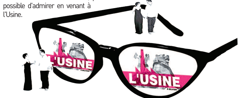
■ L'Usine laisse une grande place à la mise en œuvre de projets.