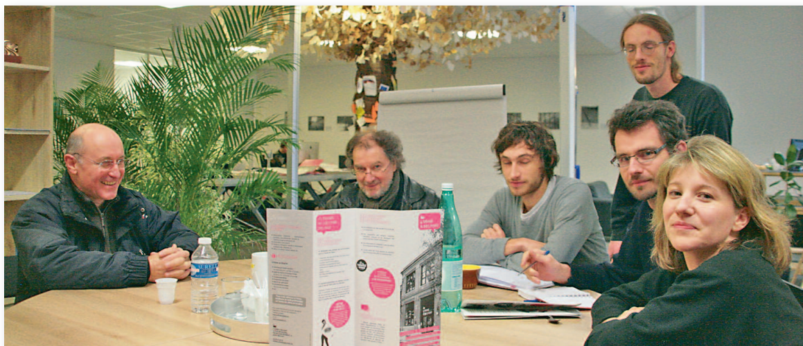
■ Un environnement adapté pour les réunions de travail en équipe.

Mardi 28 février, toute la journée (reconduit tous les derniers mardis de chaque mois) journée portes ouvertes à l'Usine.